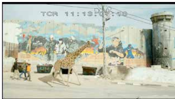
Rencontre entre le réel et le merveilleux