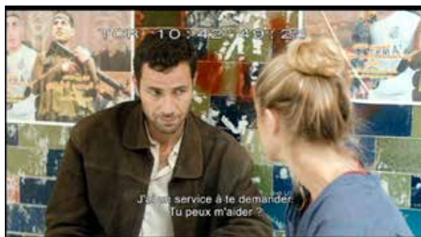
Affiche d'un soldat à l'arrière-plan : la violence est latente

Au principe d'opposition se superpose l'idée d'une cohabitation entre deux univers a priori distincts. Celui de la fiction et du réel bien sûr, du conte et du principe de réalité : le film déploie dans le même mouvement une histoire enfantine, avec tout ce qu'elle peut comporter de merveilleux (c'est la thématique du « miracle » qui est évoquée à plusieurs reprises) et les conditions de vie des Palestiniens. Les photogrammes ci-dessous constituent des exemples parlants de cette ambivalence :