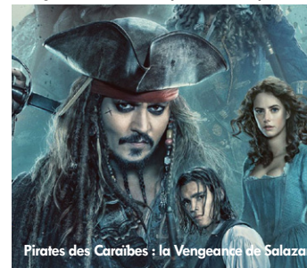
Pirates des Caraïbes : la Vengeance de Salazar