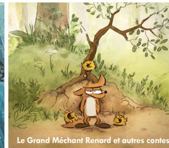
Le Grand Méchant Renard et autres contes